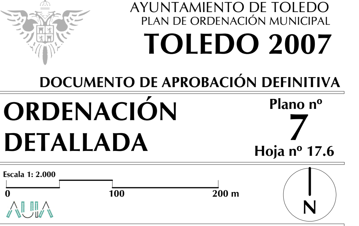
Localización sobre la cuadrícula 1:2000